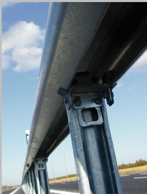
Z Ellips öppningsbar del